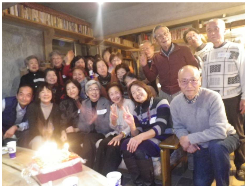
1月5人の誕生日の方を囲んで、朝どれの苺を使った バースデーケーキを前に記念写真