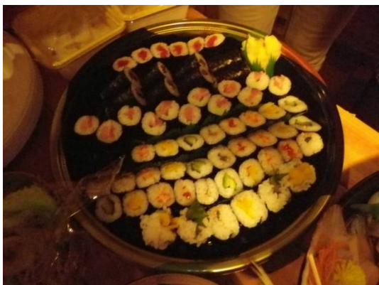
細巻き盛り合わせ