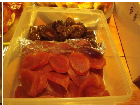
漬けもの味噌づけ