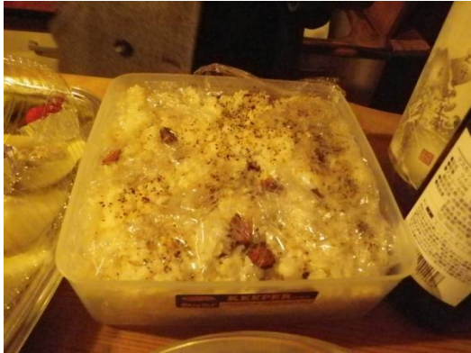
ガーリックライス その他多数