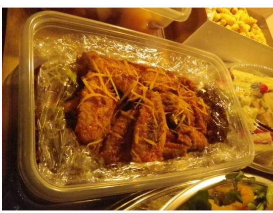
手羽先オレンジ煮