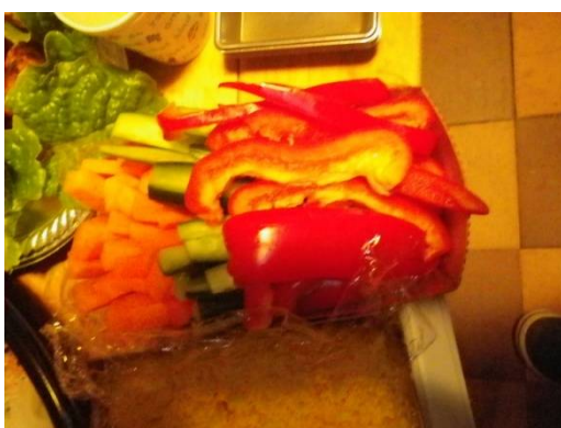
生野菜スティック