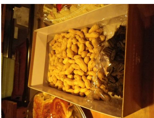
落花生 と 昆布