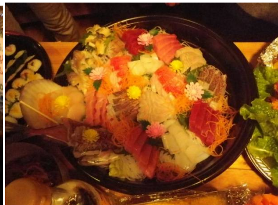
お刺身盛り合わせ