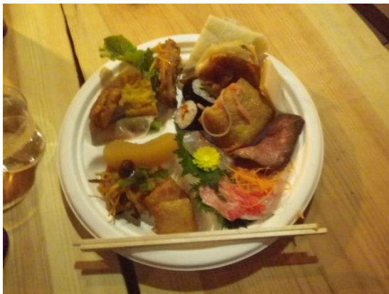
ワンプレートに一杯の料理