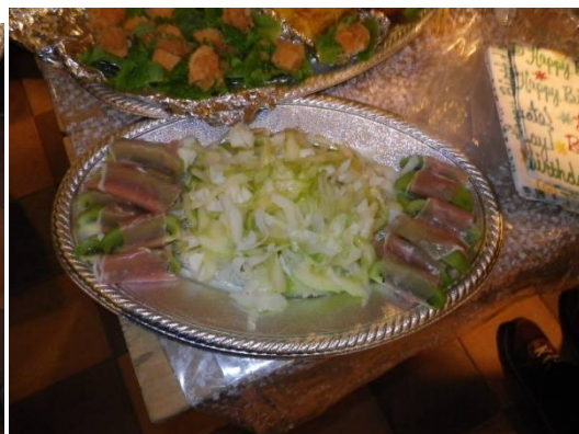
サラダ キウイの生ハム巻き