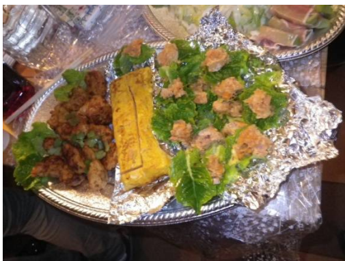
チキンナゲット 出汁巻き アンキモ