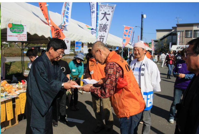
福興市では大磯特産のマコモダケやヤーコン早生ミカン 8月に南三陸来た大磯国府中学校生徒からのの募金を町長に託す i や老舗の逸品を販売